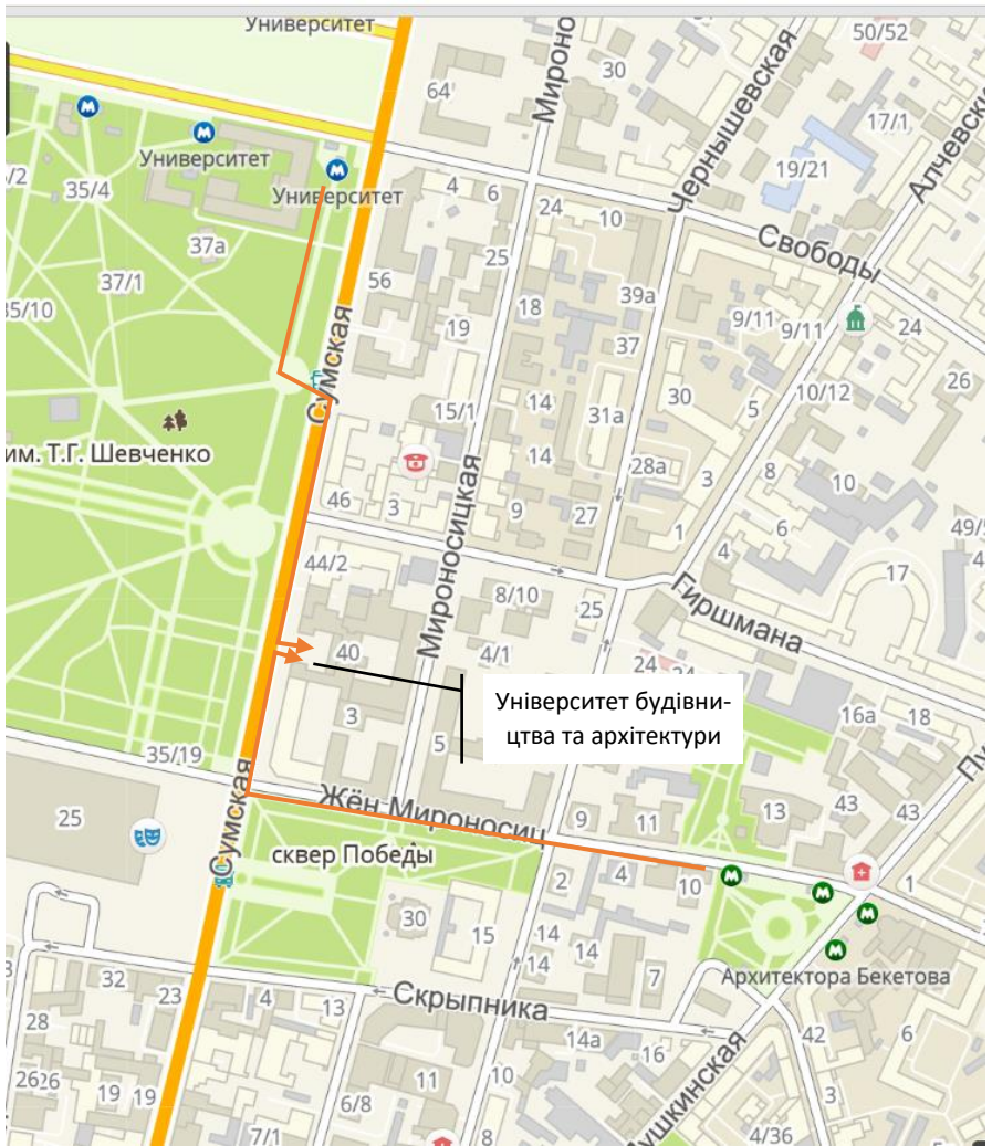
Місцезнаходження Харківського національного університету будівництва та архітектури